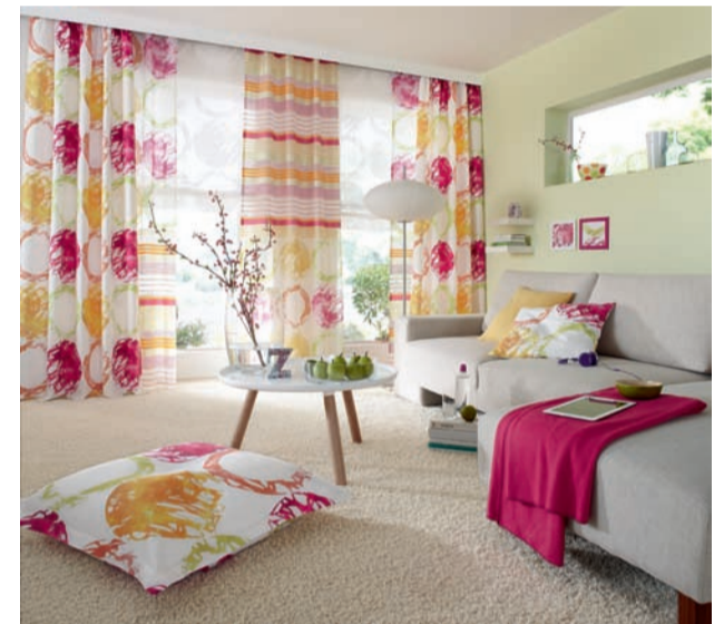
Dekoration mit farbenfrohen Gardinenstoffen von Gardisette