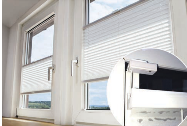
Plisseerollos ohne Bohren mit der neuen Klebetechnik befestigen

Die neuen Plisseerollos verfügen über ein Klebprofil, das sich ganz ohne Werkzeug ankleben lässt. Mit dieser Klebetechnik können Plisseerollos direkt am Fensterglas befestigt werden und Sie sparen sich ärgerliche Löcher im Fensterrahmen.